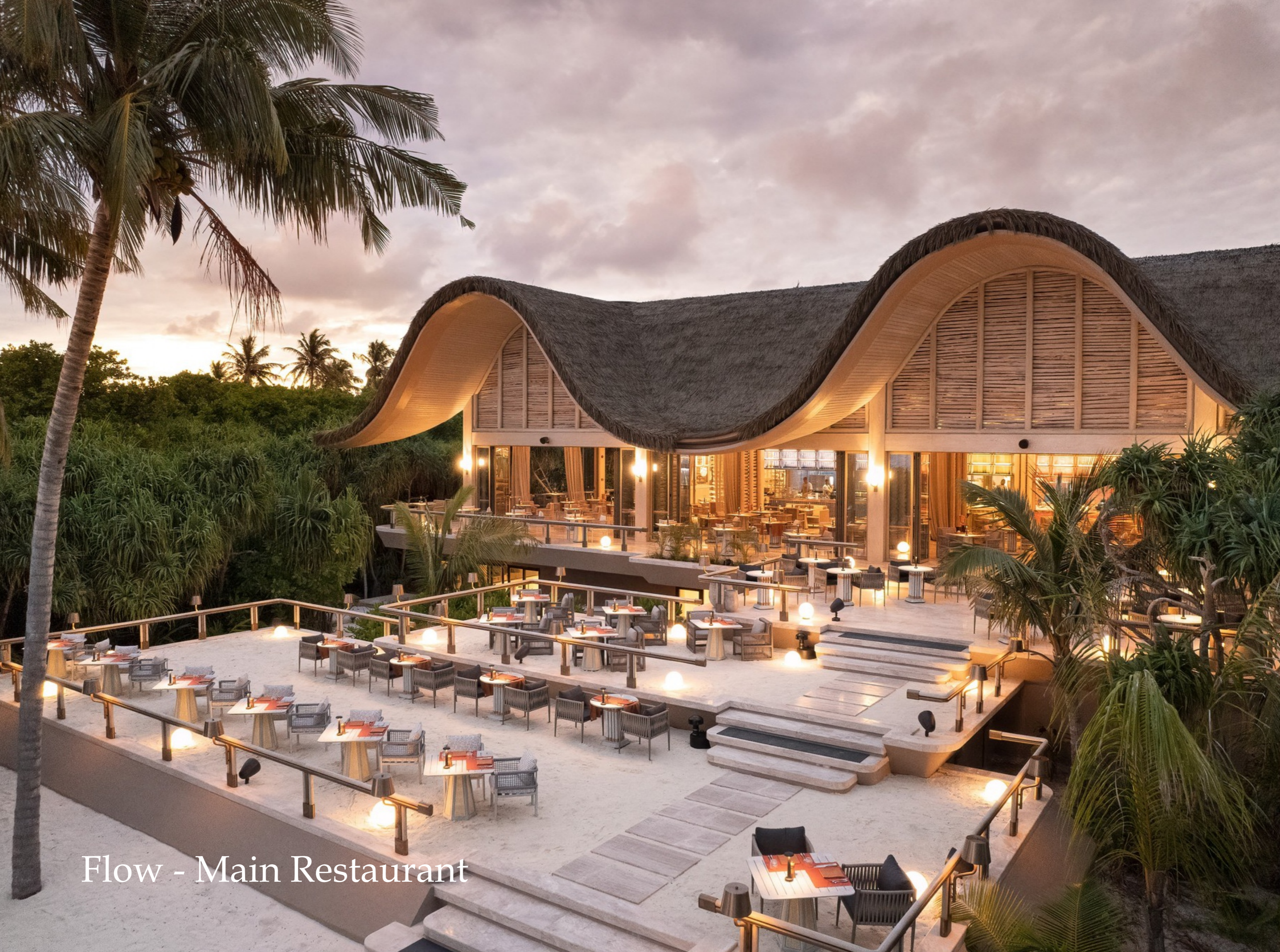
Flow - Main Restaurant