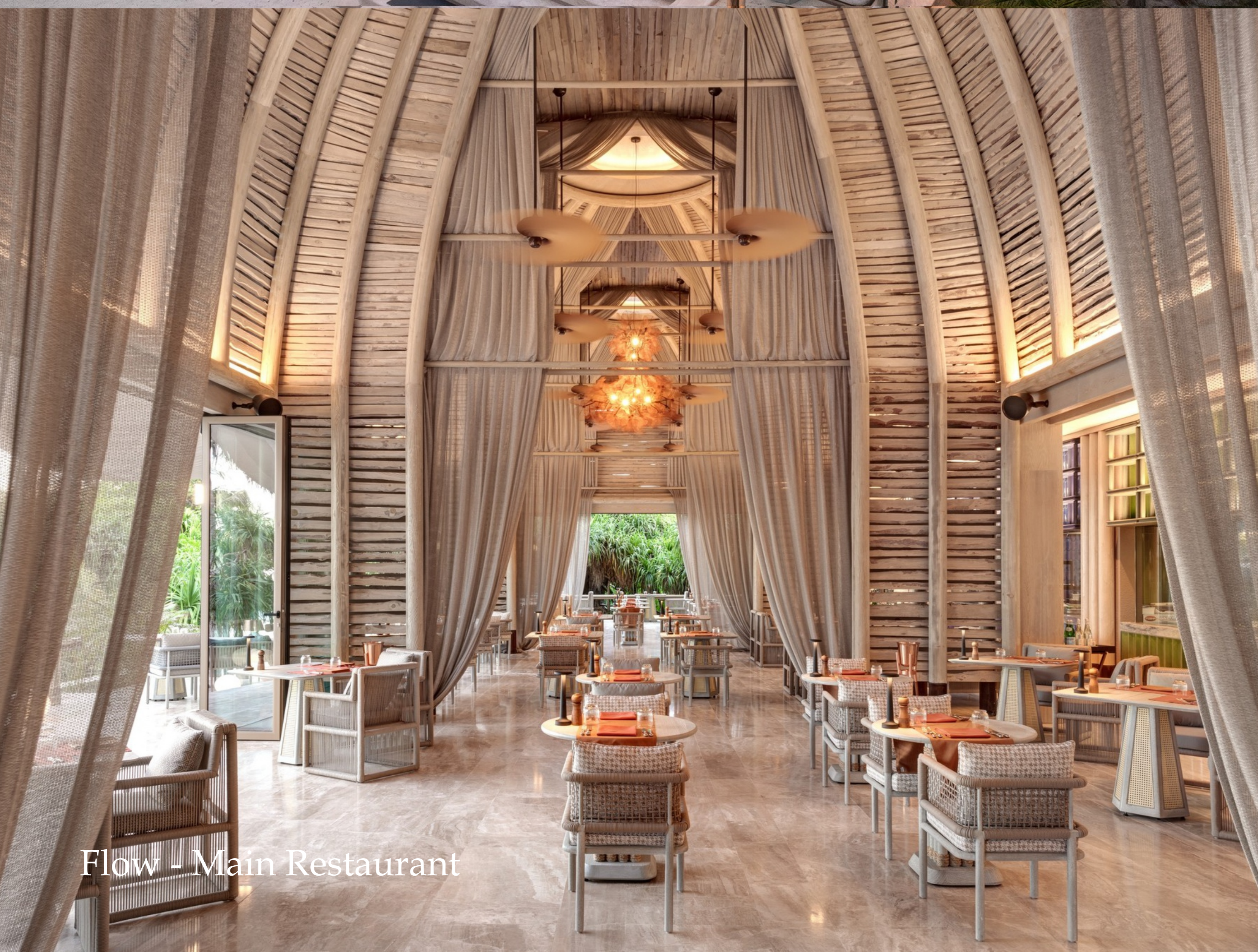
Flow - Main Restaurant