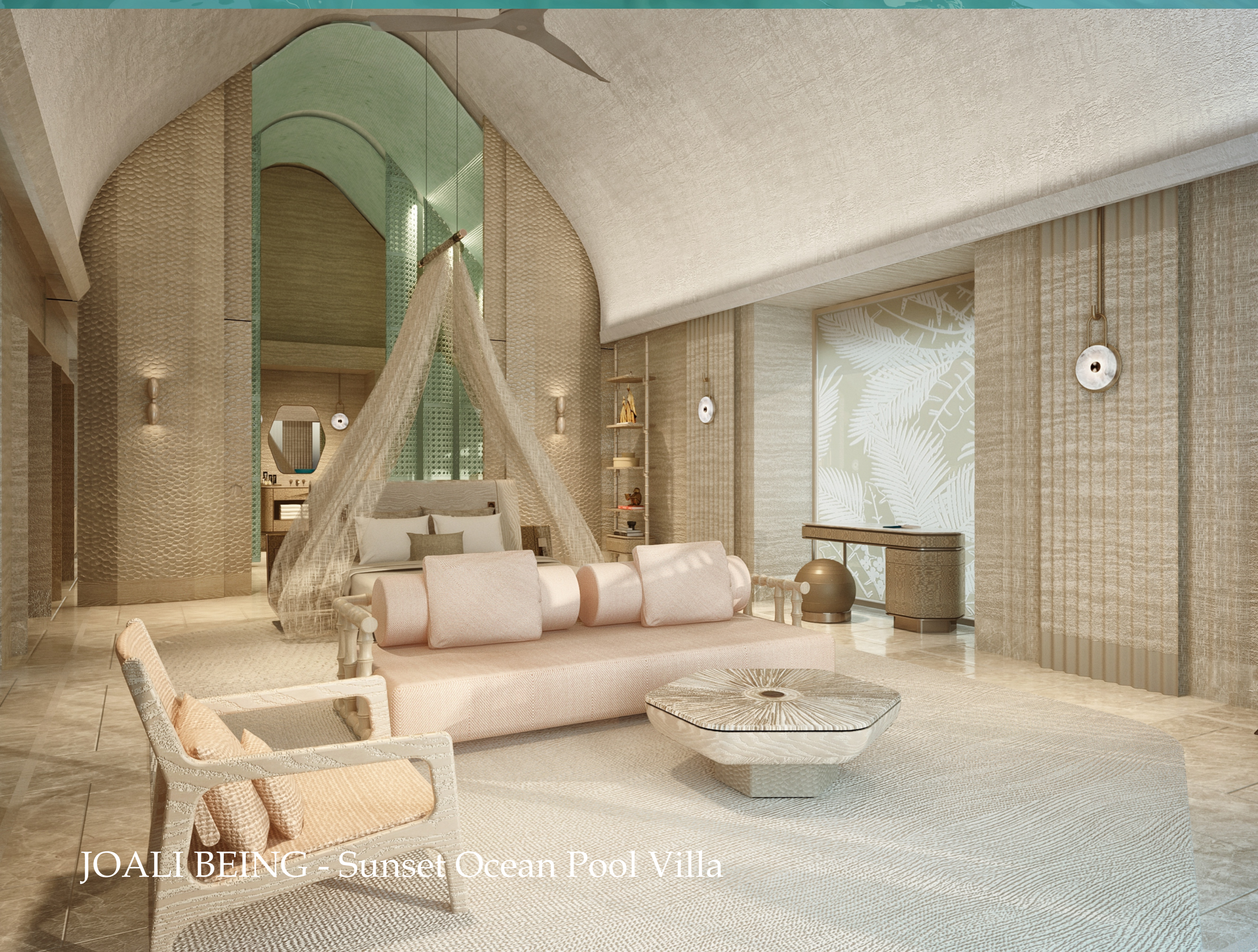
JOALI BEING - Sunset Ocean Pool Villa