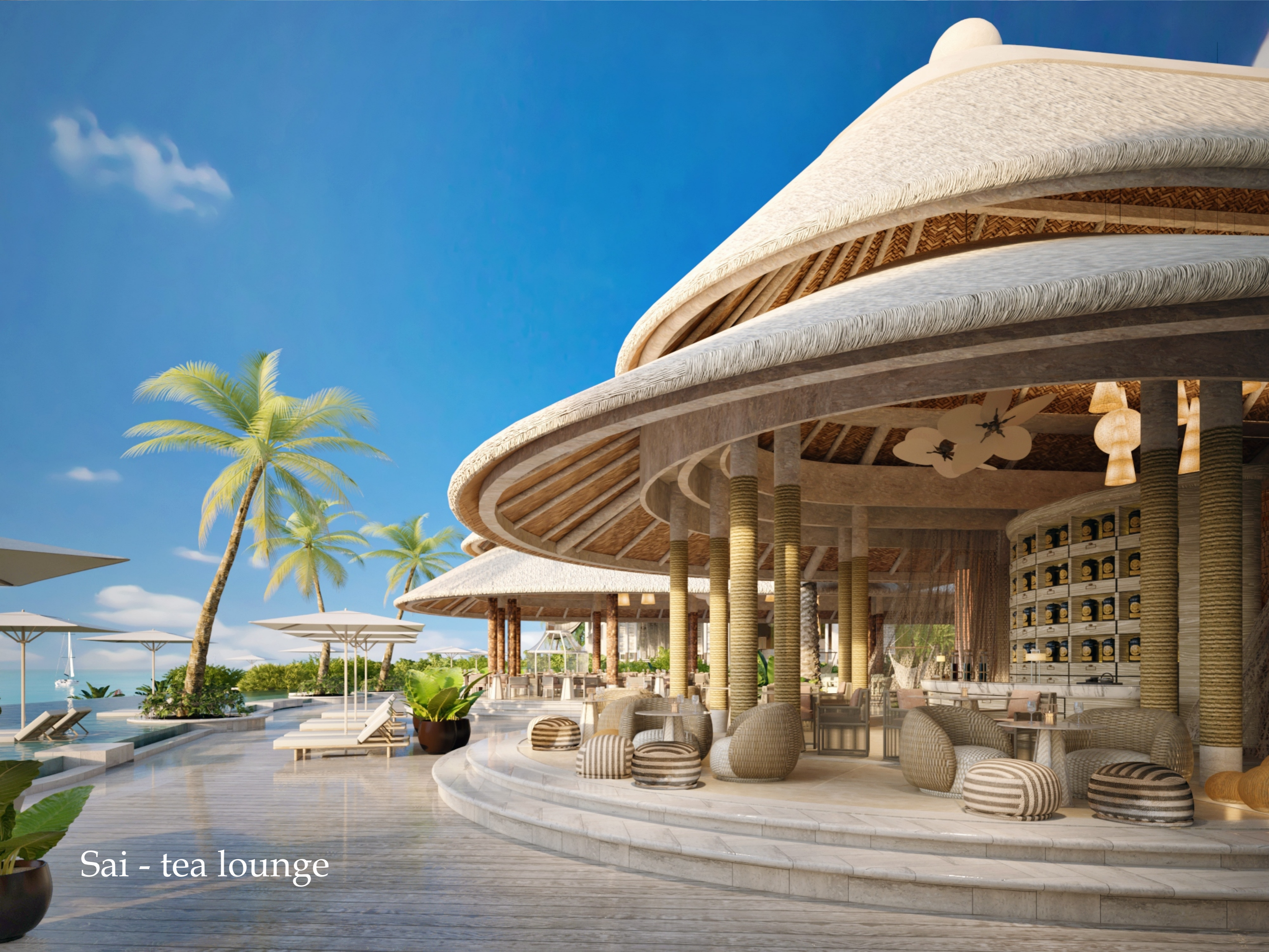
Sai - tea lounge