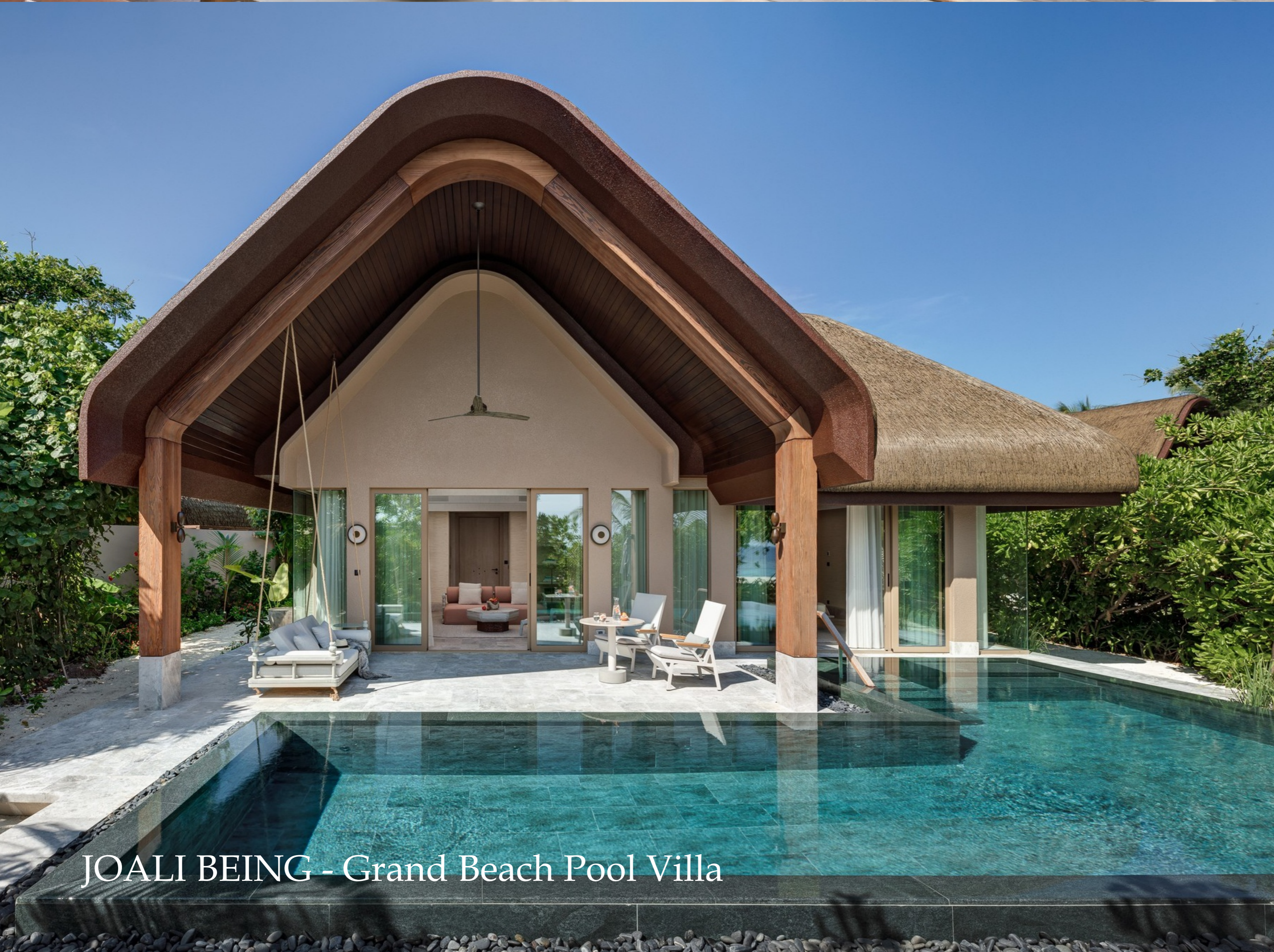
JOALI BEING - Grand Beach Pool Villa