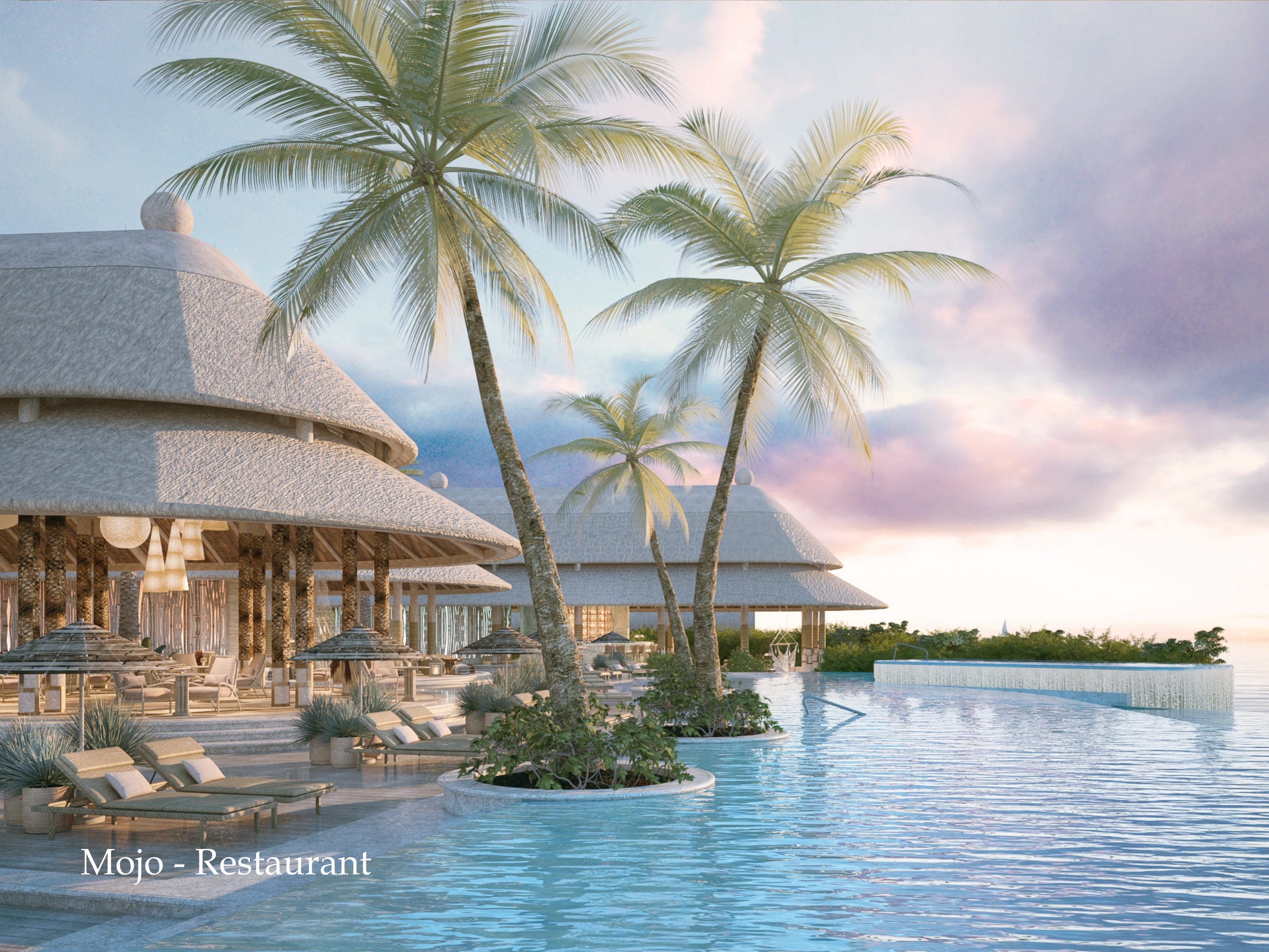
Mojo - Restaurant