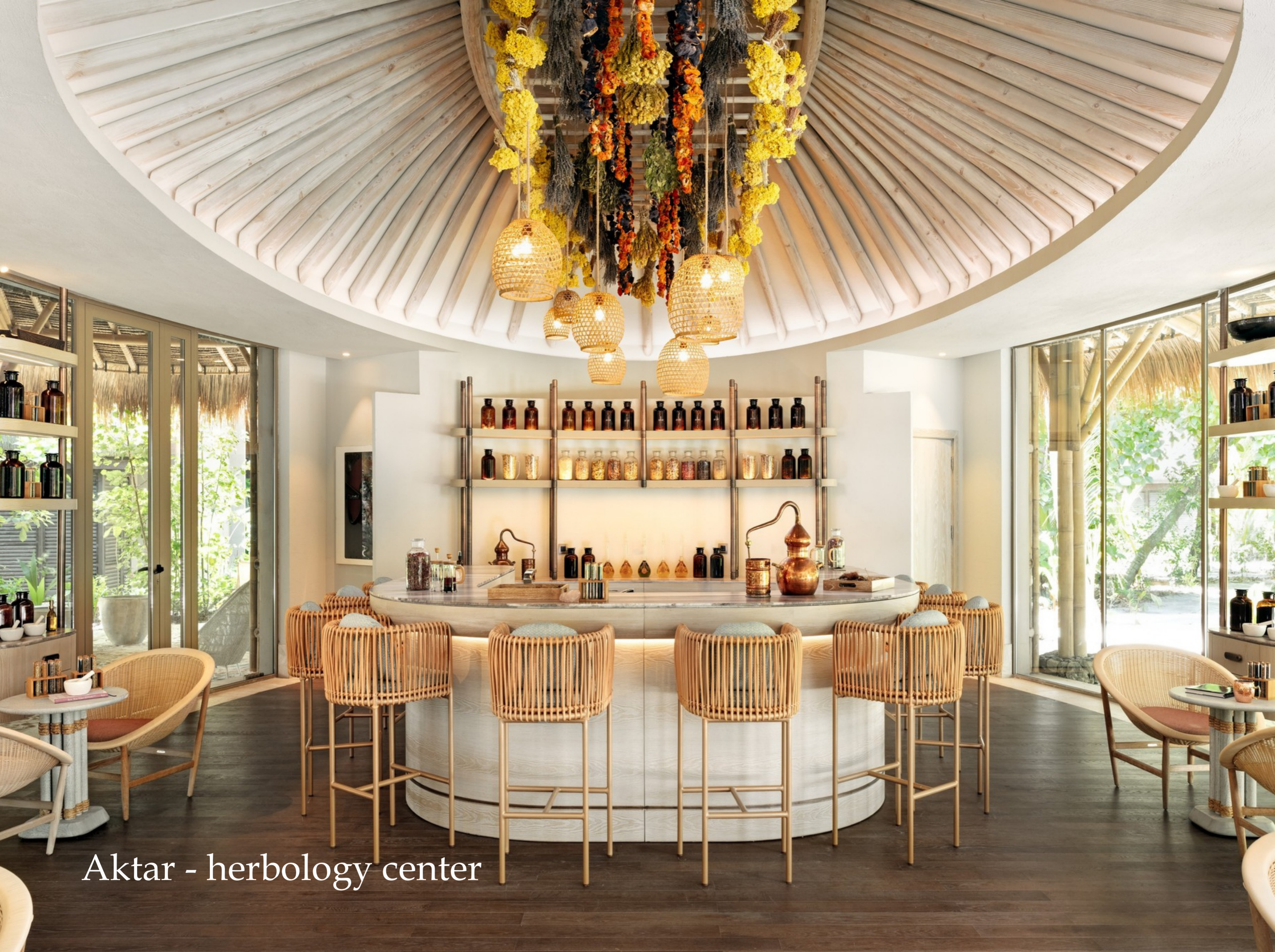
Aktar - herbology center