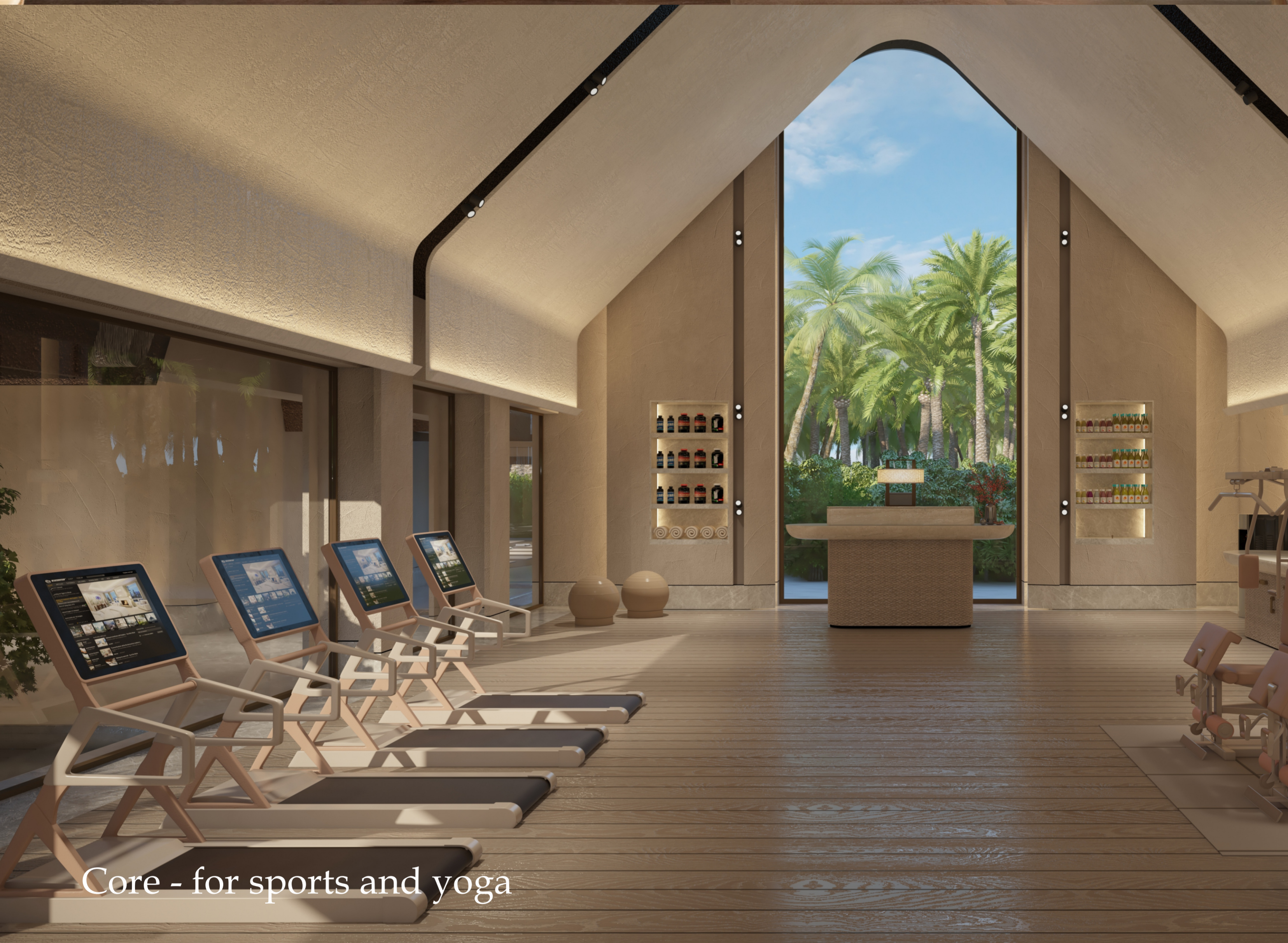
Core - for sports and yoga