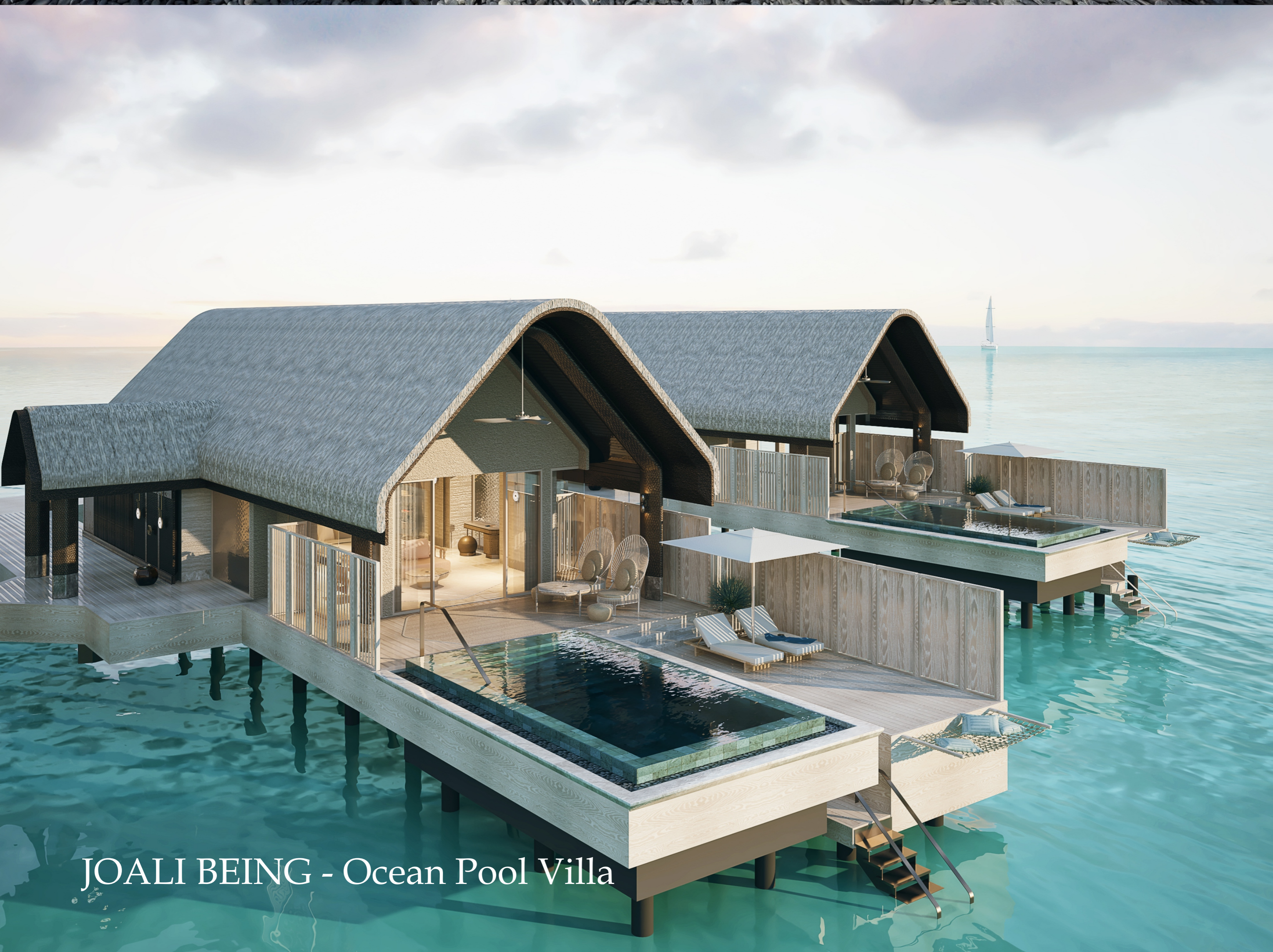
JOALI BEING - Ocean Pool Villa