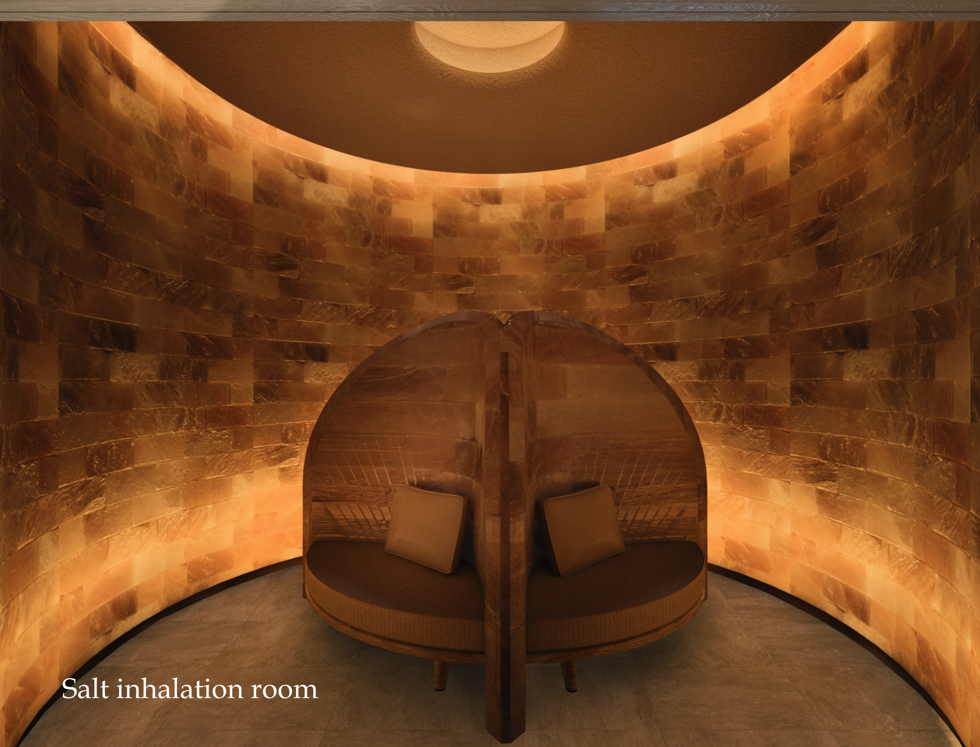
Salt inhalation room