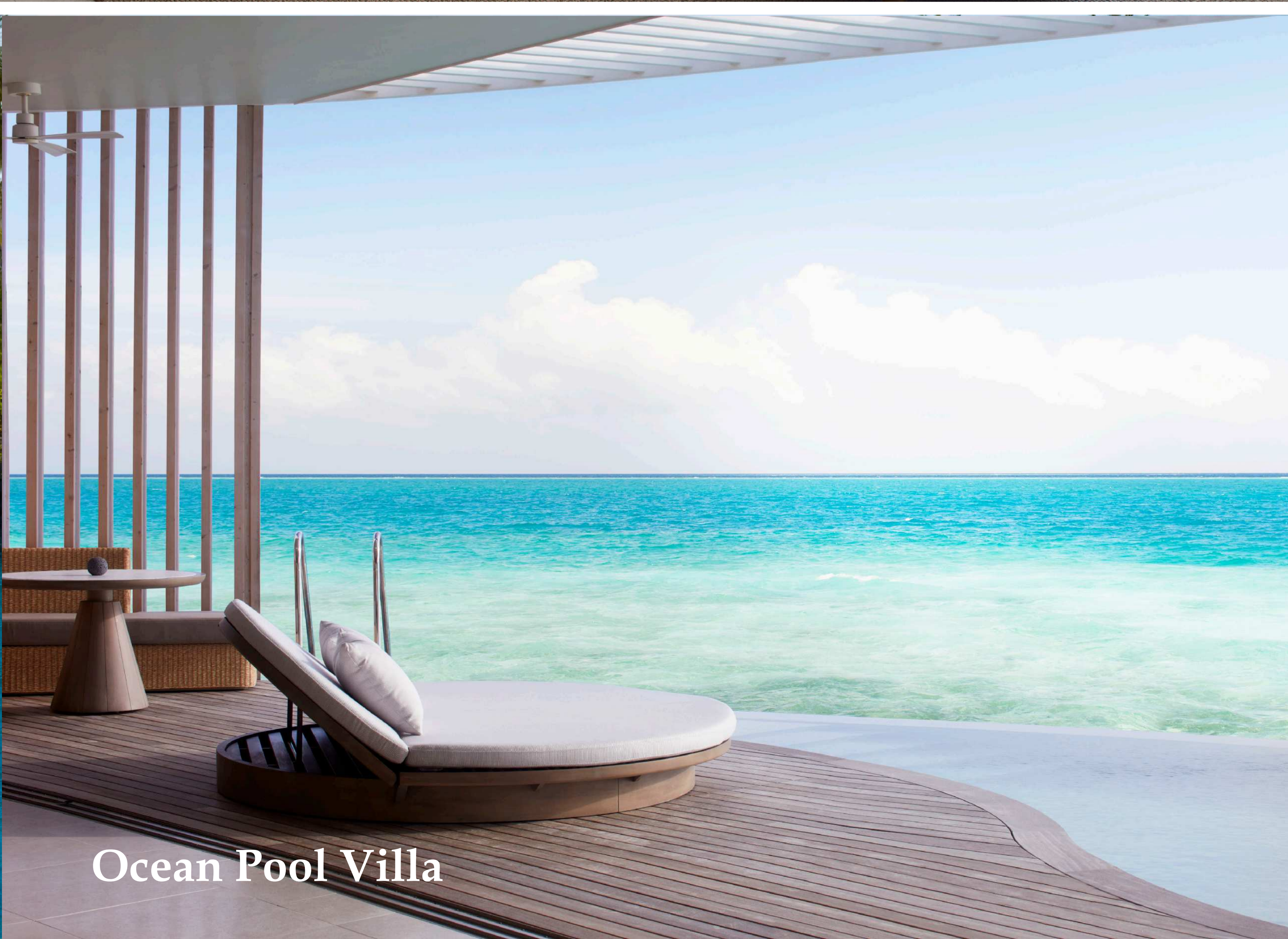
Ocean Pool Villa