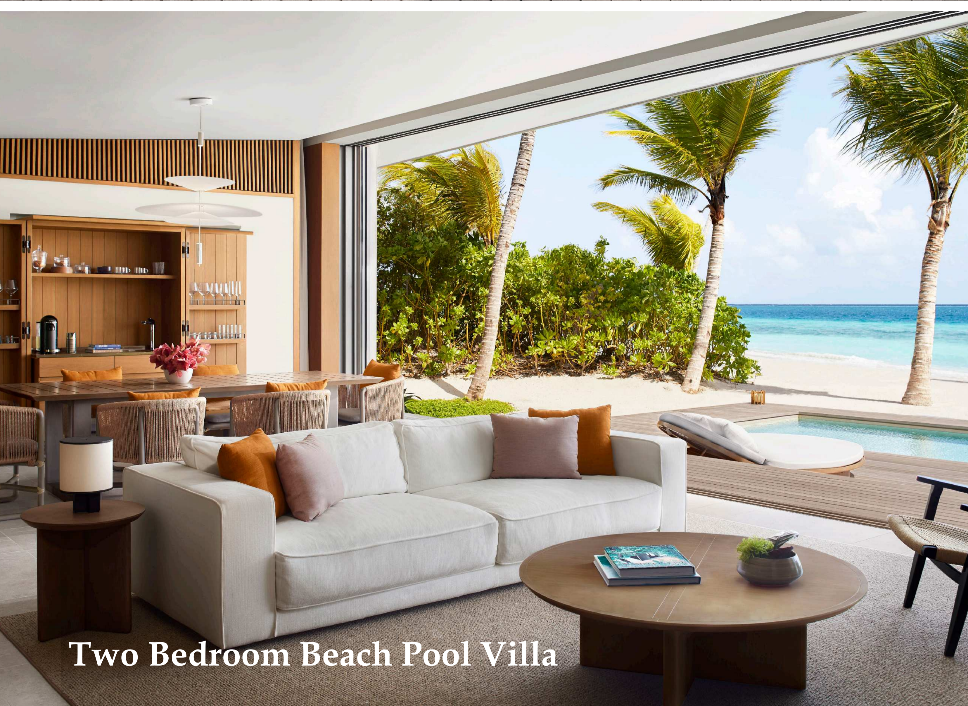
Two Bedroom Beach Pool Villa