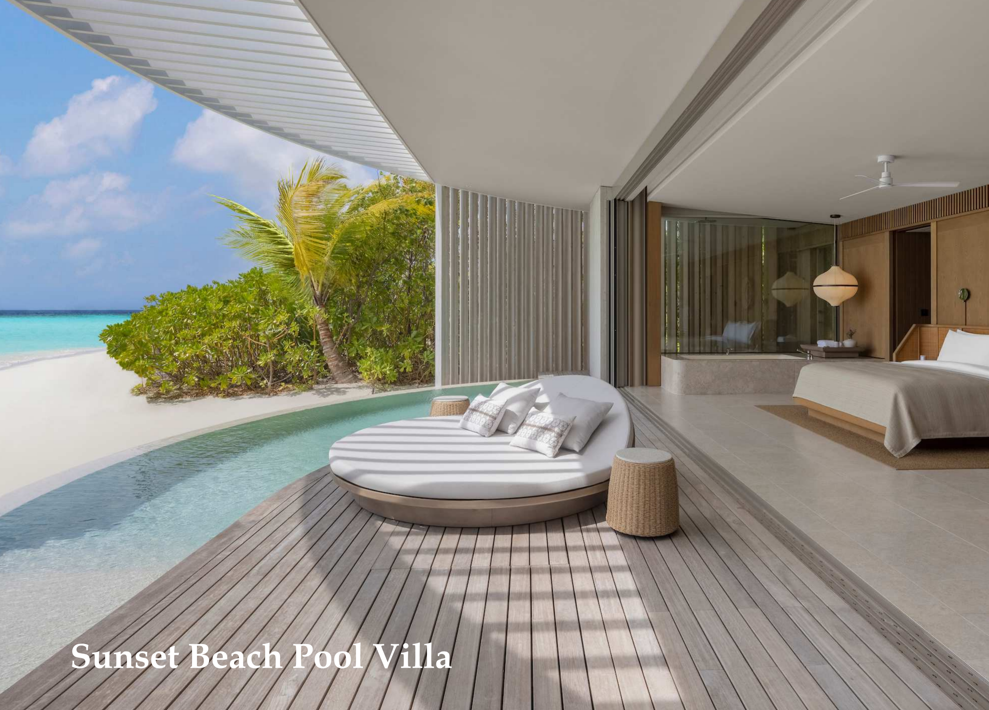
Sunset Beach Pool Villa