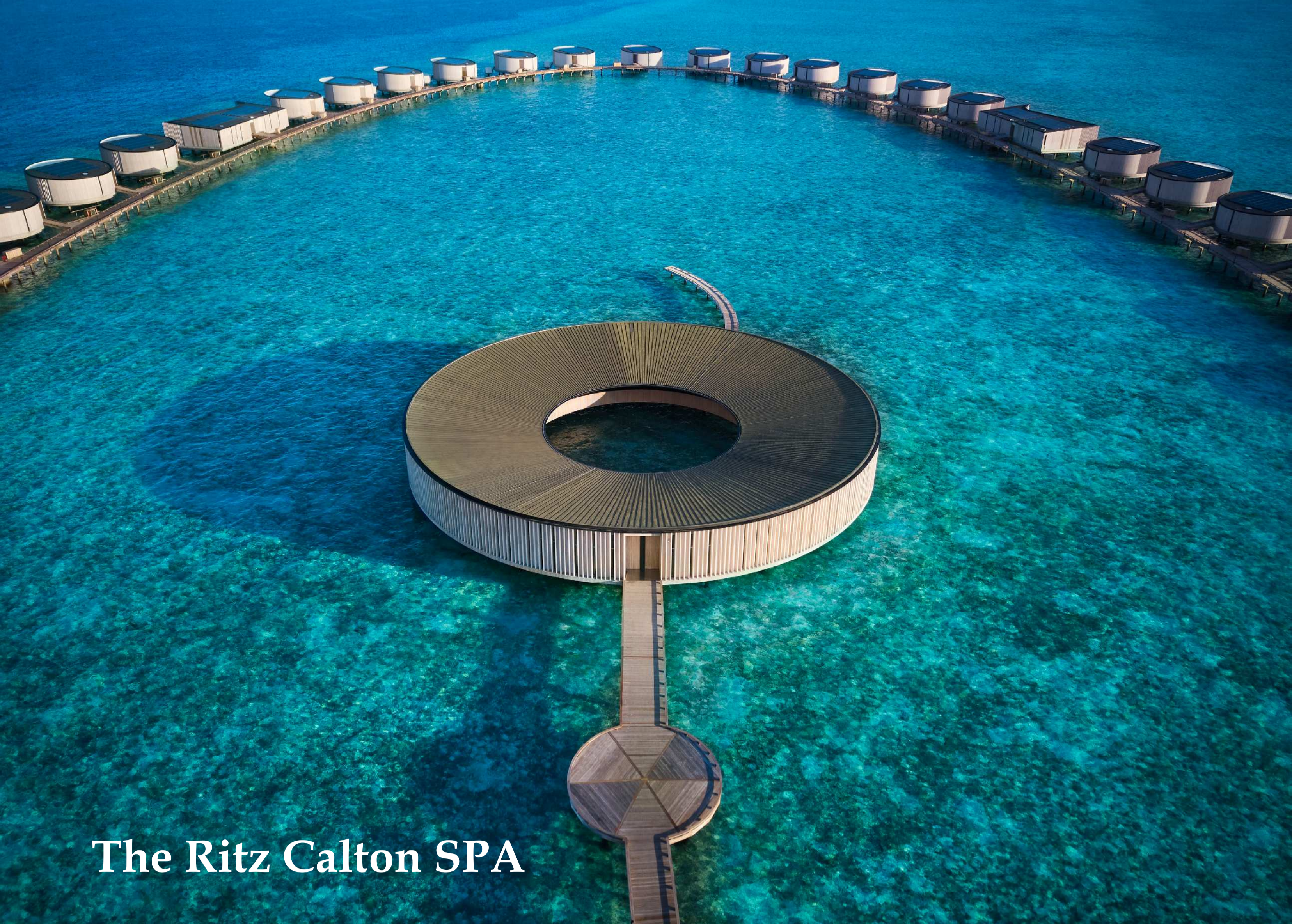
The Ritz Calton SPA